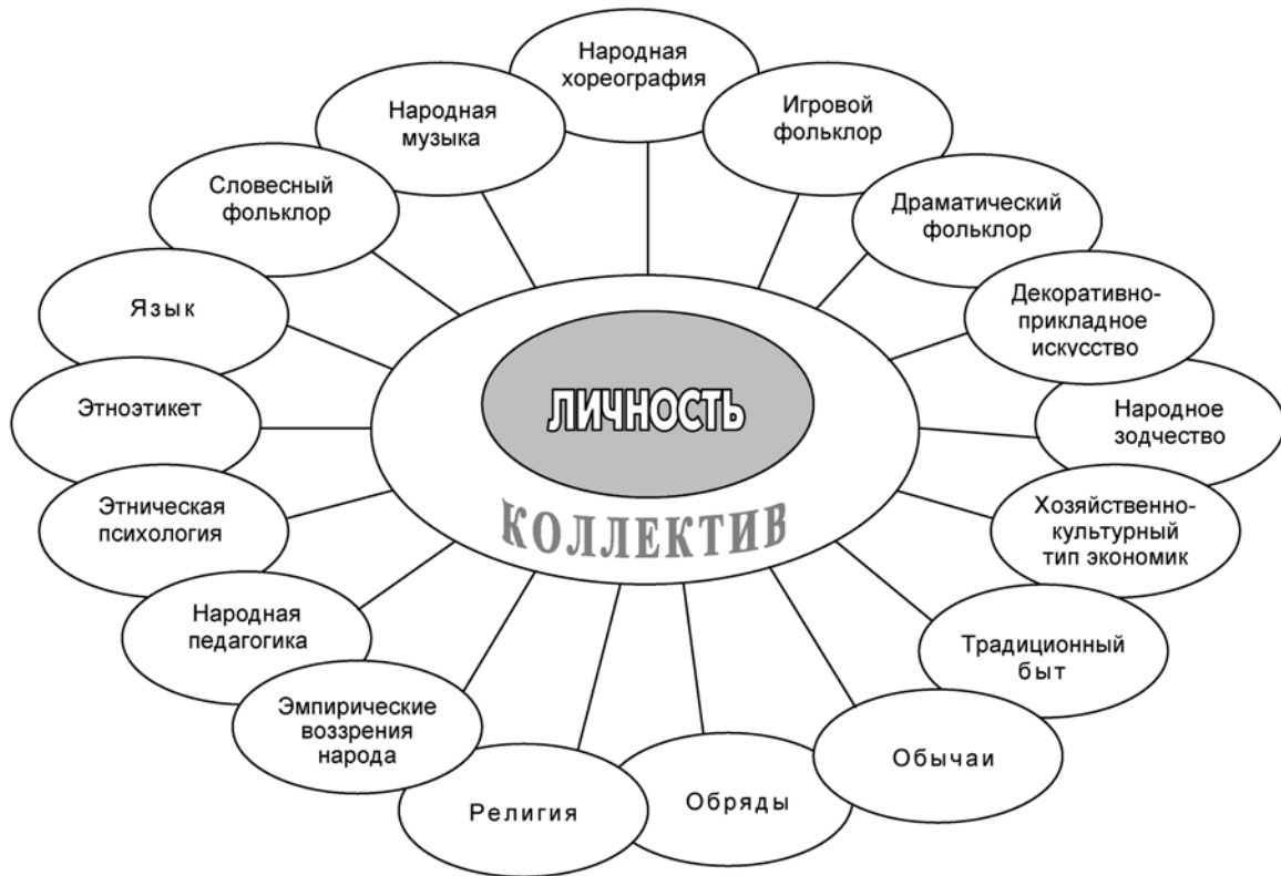
Рис.1. Структурная модель этнокультуры.

экология, философия и др.), народная педагогика, этническая психология и этноэтикет. В верхней части кольца – более подвижные, постепенно изменяющиеся, разрастающиеся в разнообразных формах составляющие этнокультуры – системообразующий элемент – язык – и народная художественная культура во всех ее видах: словесный, музыкальный, хореографический, игровой, драматический фольклор, декоративно-прикладное искусство, народное зодчество.