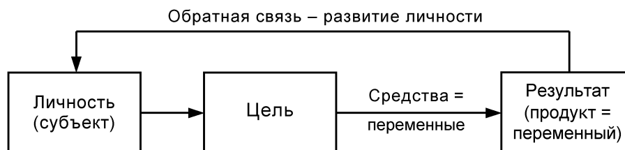
Рис. 3. Научно-креативная модель профессиональной подготовки специалистов.

В рамках научно-креативной модели предполагается гибкое сочетание самостоятельных видов деятельности обучаемых и оперативного, систематического взаимодействия их с преподавателем-консультантом, координатором; индивидуальной и группо-