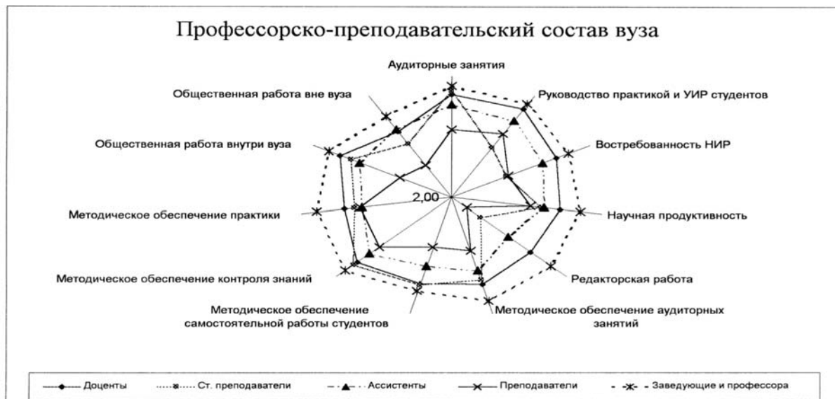
Рис. 1. Показатели самооценки качества научно-педагогической деятельности ППС вуза

ствующей группе преподавателей) и значение показателя преподавателя, участвующего в (само)оценке. При этом для формализованной оценки соответствия критериям средней оценки на эпюре указано значение индекса соответствия критериям средней оценки J в каждой статусной группе (см. рис. 1).