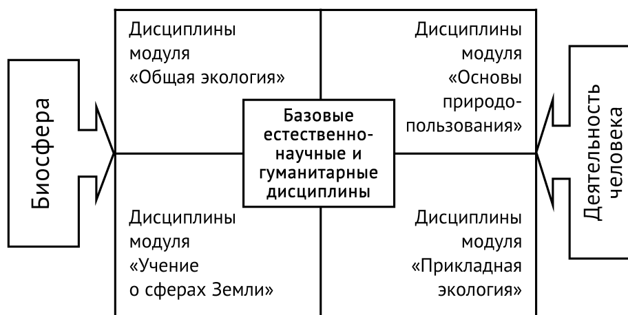
Рис 2. Структура общепрофессиональной части содержания высшего профессионального экологического образования естественнонаучной направленности.

В основе высшего профессионального образования практически любого профиля лежат базовые дисциплины гуманитарного и естественнонаучного циклов (центральная часть рис. 2), без знания которых невозможно изучение общепрофессиональных дисциплин. Для направления «Экология и природопользование» дисциплины гуманитарного и естественнонаучного циклов были определены в начале 1990-х гг., и их состав остался неизменным. Однако перечень дисциплин общепрофессионального блока постоянно пересматривался по мере появления сомнений в